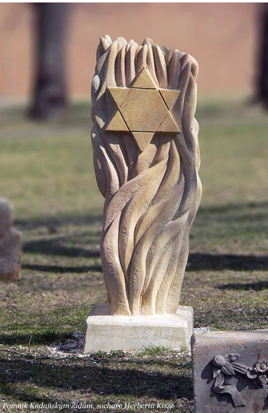
Pomník Kadaňským Židům, sochare Herberta Kisze