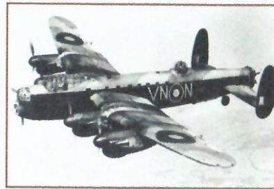
83 Sqn Lancaster B Mk1 bomber