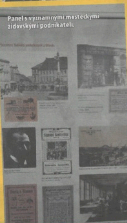
Panel s významnými mosteckými židovskými podnikateli.