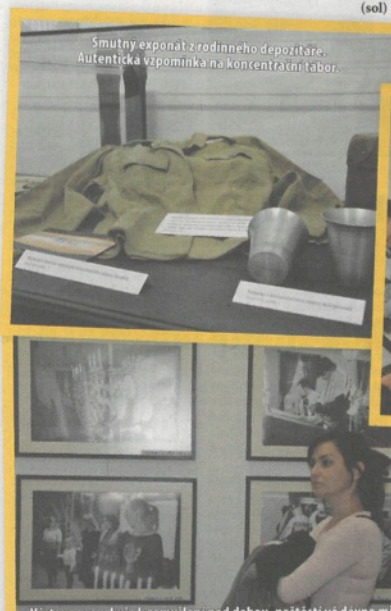
Výstava provokuje k zamýšlení nad dobou, nastěží už dávno minulou.