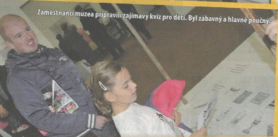
Zaměstnanci muzea připravili zajímavý kvíz pro děti. Byl zábavný a hlavně poučný.