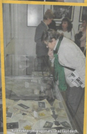
Nad některými exponáty se až tajil dech.